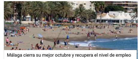
Málaga cierra su mejor octubre y recupera el nivel de empleo