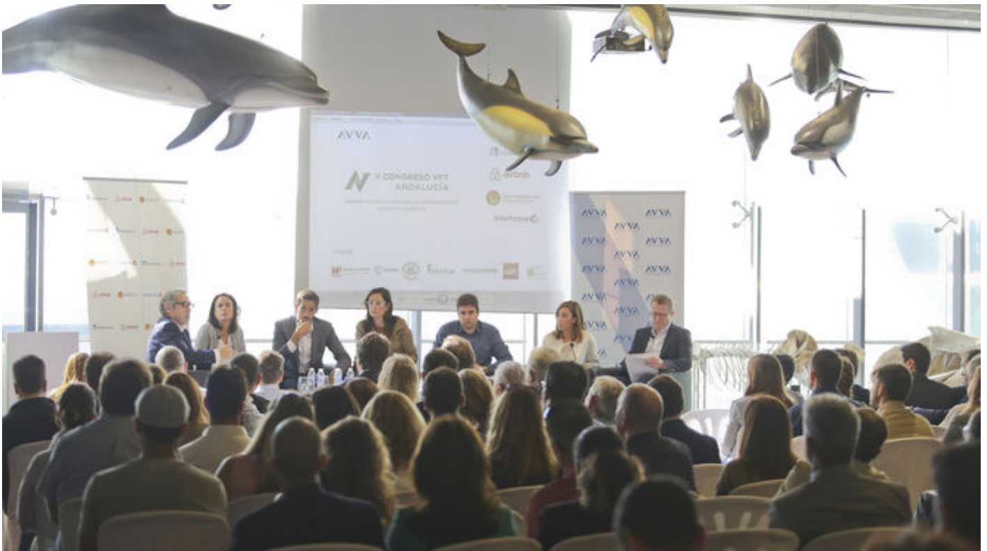
Directivos de varias plataformas participaron ayer en el II Congreso de Viviendas con Fines Turísticos de Andalucía.

▫ Homeaway o Airbnb piden una regulación "eficaz" y reconocen falta de comunicación con las instituciones